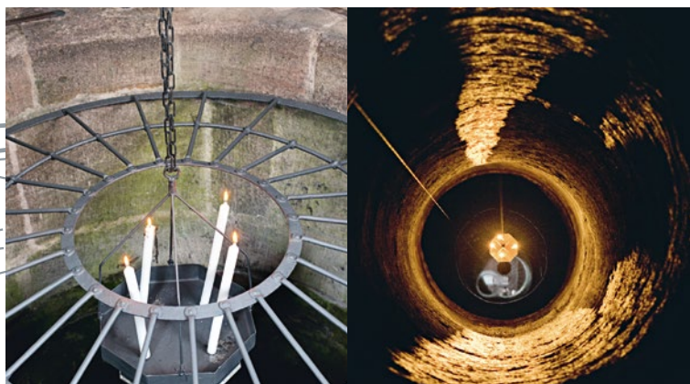
Vista nella cavità del Pozzo profondo

Il Pozzo profondo al centro della fortificazione esterna fu costruito, per l'approvvigionamento idrico autonomo, forse già nella prima fase di costruzione del castello. La sua cavità è scavata per circa 50 metri nella roccia. Una carrellata filmata e un'illustrativa visita guidata permettono ai visitatori di apprezzarne la profondità.