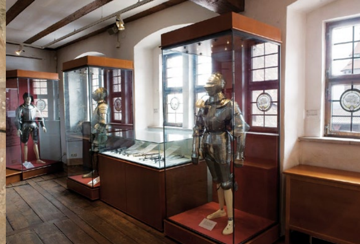
Vista nelle sale della mostra nelle 'Kemenate'