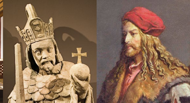
L'imperatore Carlo IV (sin.); Albrecht Dürer (ds.)