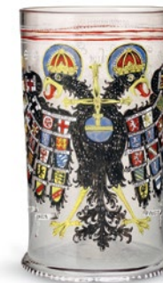
Sigillo della Bolla d'oro (replica), Monaco di Baviera, Bayerisches Hauptstaatsarchiv (in alto); Centrotavola Merkel, Museen der Stadt Nürnberg (al centro); Boccale con l'aquila imperiale, XVII secolo (destra)