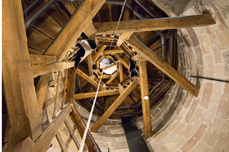
Vista sulla scala della Torre 'Sinwell'